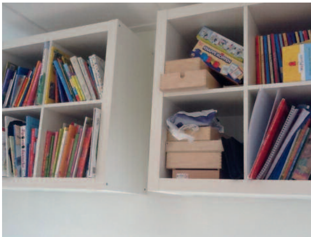
Voorleeshoek voor de training (Kapelle)