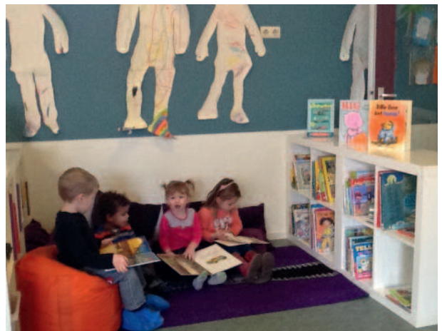
Voorleeshoek na de training (Kruiningen)