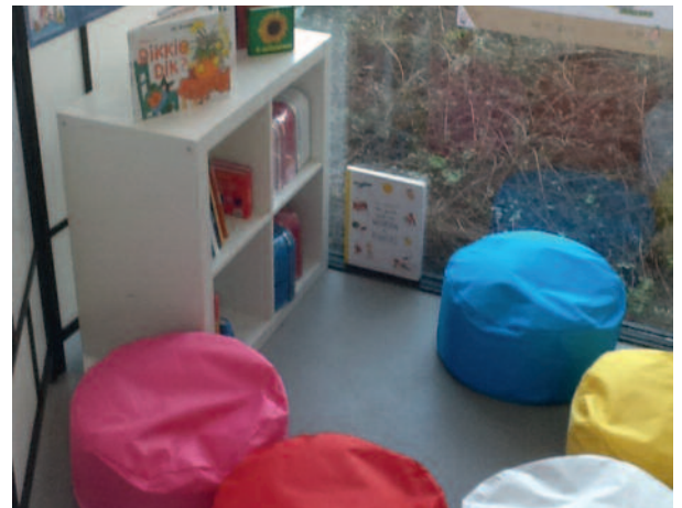
Voorleeshoek na de training (Kapelle)